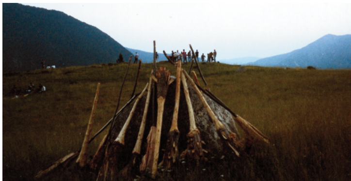
Rantiners i falles dels joves a Taüll, el 1999.

ajuda a enganyar-nos. Les relacions humanes, diria qualsevol, no s'han pogut interrompre tant per l'arribada de la carretera a tres pobles més avall. Però així ha de ser: si no, només ens quedaria la simultaneïtat de la festa de falles i major als dos pobles per explicar l'elevat nombre de divergències que s'hi troben, i que diríem que abans dels anys trenta ja hi eren. Quant al bedoll, és un element clau, que el fa divergent de tota la seua vall (on cremaven palla) i de tota la Ribagorça (on cremaven teia, com a San Juan de Plan, o de rames) i el fa coincident, com hem apuntat ja al començament, amb Les i amb la vall del Valira.