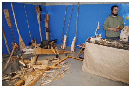
Tipologia de Falles: Sebastià Jordà i les seues estudiades rèpliques de totes les falles, al natural i en miniatura.