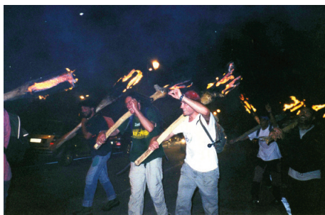
Rantiners grossos de Taüll, l'any 2004, quan les Falles van cremar en dissabte.