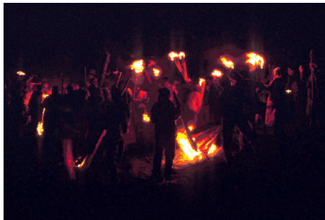
Encenen les falles en un algun faro ribagorçà.

Segon, vegem quin tipus de cremada fan. Les Festes de Falles ribagorçanes conserven majoritàriament un faro de dalt, una baixada, una correguda pel poble, coca i vi repartit a l'arribada, i també una baixada de canalla, sigui just abans o encadenada (i un faro xic o dels xics, donques ). Majoritàriament han perdut el faro (haro) o falla grossa de la plaça (i de fet la majoria no fan el ball vora el foc), les danses i les falles que s'hi podrien cremar giravoltant-les entorn, i en fi, la visita al cementiri i d'altres elements que després de les emocions de la recerca estem segurs que eren presents a tots els pobles.